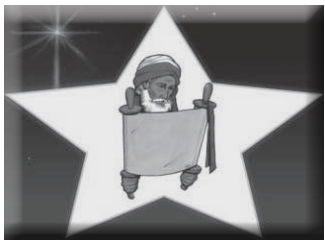
(图 MS3, 拿着卷轴的人)

当他们在那里不断的研究时，他们突然发现：“咦！在那边有一颗新的星，我们从来没有见过的？”“这颗星星在犹太省的方向，到底这有什么意义呢？”“到底是什么呢？”因为博士们不是犹太人，原来他们住在离犹太很远的巴比伦。好多年以前，在他们的国家，住着许许多多的犹太人，其中有一个非常有名的人，也是非常智慧的人叫作一但以理，但以理认识创造宇宙的神哦，所以他也写了一些有关神的书。