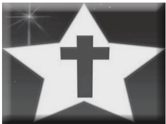
(图 MS10, 十字架)

你知道耶稣是如何成为世人的救主吗？圣经告诉我们，因为神爱世人，祂派耶稣来担当世人的罪，不仅为犹太人，也为这些博士、你、我的罪。神的儿子成为人的样子，来到世上，祂慢慢长大，却没有犯过罪，没有做过一件坏事。圣经说：“祂被挂在木头上，亲身担当了我们的罪。”（彼得前书 2:24）祂被钉在十字架上，钉子穿过祂的手和脚，宝血为你我流出，亲身担当了我们的刑罚。神的话说：“基督为我们的罪死了，而且埋葬了；又照圣经所说，第三天复活了。”（哥林多前书 15:3-4）非常奇妙，祂死了，埋葬了，第三天从死里复活；祂现在回到天堂。祂是神所差来作世人的救主。