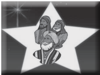
（图 MS6，换上新衣服的博士）

如果认识希律王的人都知道，他在说谎。当然，那些博士并不认识希律。他们以为他会心口如一。就像有时候你、我说了一些话，以为可以欺骗别人，让别人都信以为真，但是骗不了神！祂知道我们的罪，知道你、我生下来，就有要去犯罪的心；圣经说：“没有义人，连一个也没有。”（罗马书 3:10）有没有人教你说谎？教你恨人、打架、自私？但每个人都会这样做。你和我的罪使我们与神分开了。你要如何处理那些罪，让你可以认识神呢？神差派祂的独生子要来解决这个问题。而希律王说谎，博士们并不知道。