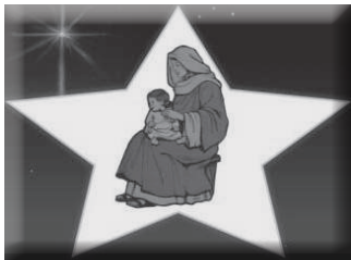
（图 MS8，马利亚与婴孩耶稣）

他们快快离开王宫，转向伯利恒。他们只要再多走五、六哩路。他们感到十分兴奋。（用兴奋的声音）“啊，看……那星星……它正在移动！”