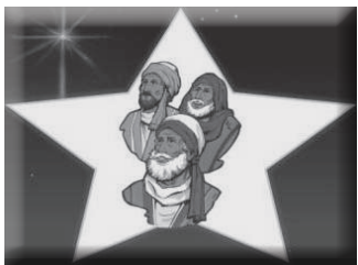
(图 MS2, 博士)

圣经上告诉我们，当神把一颗新的星放在天空中，是要告诉人们一个特别的消息。可是，人们要如何知道呢？我们一起来听记载在圣经这一件非常奇妙，特别的事。