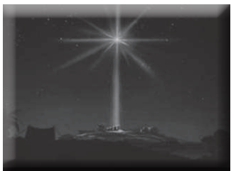
(图 MS1, 背景图)