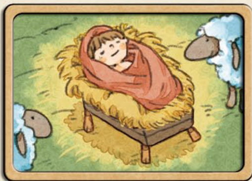
1_ 以婴孩的样式出生