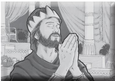
（图片一，祷告的大卫王）

神希望你什么样的话呢？神为什么希望你能说出鼓励人的话语呢？（引导小朋友说出“神是爱，很亲切，很温柔，很良善”等答案）神希望你能像祂。