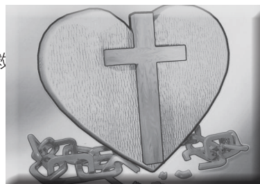
（图片六，十字架与断开锁炼的心）

让我们来看看金句的前半段，“耶和华—我的磐石，我的救赎主啊，愿我口中的言语、心里的意念在你面前蒙悦纳。”