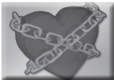
（图片五，黑心旁边的锁炼）

因为我们都是罪人，所以我们的舌头不会只说正确的话，神说：“世人都犯了罪。”（罗 3:23）。我们都喜欢按照自己的方法做事，而不是按照神的方法，圣经说我们犯罪时就成为罪的奴隶，我们的罪使我们与圣洁的神分离。我们应当为我们所犯的过错受到惩罚，罪的刑罚是死亡，这代表我们将永远与神分离。